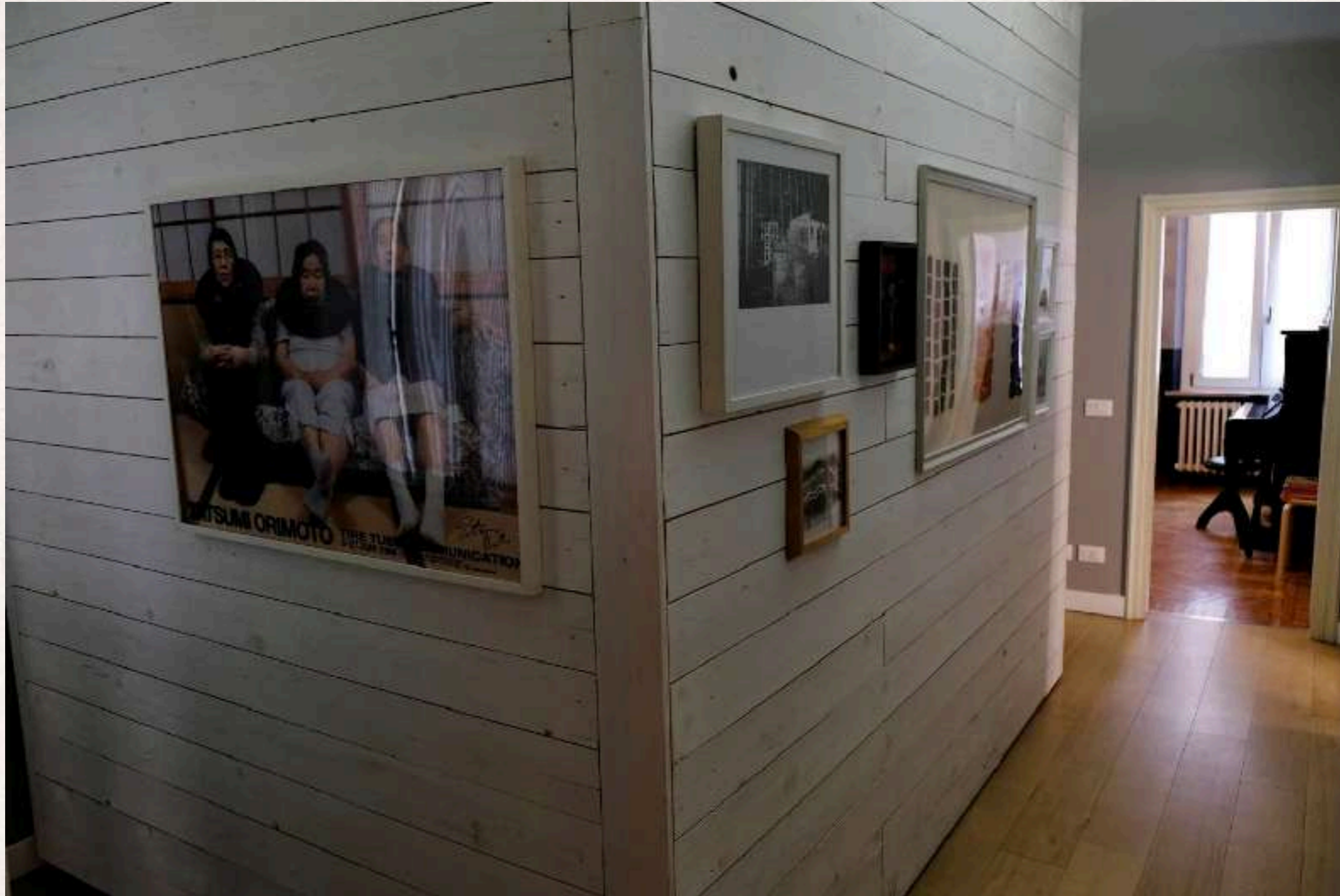
CAMERA CON CABINA ARMADIO